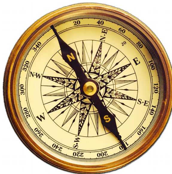
Das Gewissen als ethischer Kompass des Menschen

Das Gewissen wird manchmal auch im Bild eines Kompass beschrieben. Ein Kompass zeigt dem Wanderer an, wo Norden und Süden ist und er kann sich dadurch klar in der Landschaft orientieren. So kann auch das Gewissen des Menschen wie ein ethischer Kompass sein, der anzeigt, was richtig und falsch ist.