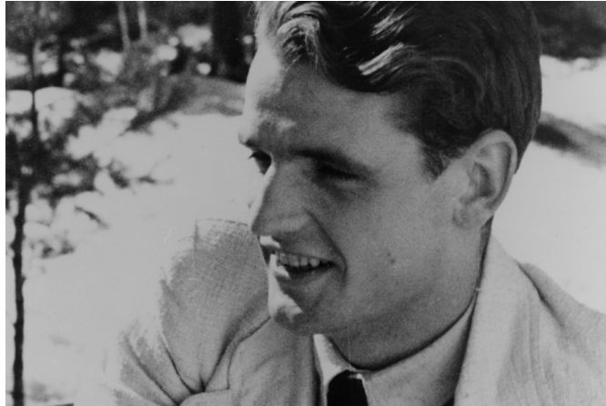
Hans Scholl (1922 - 1943)

„Sollen wir am Ende dieses Krieges mit leeren Händen vor der Frage stehen: Was habt ihr getan?“