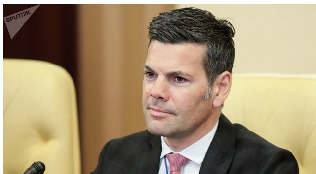
Ken Jebsen 9