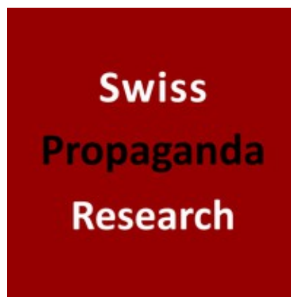
Das Logo des kritischen Medienforschungsprojektes

Bevor ich den Medien-Navigator vorstelle, noch ein paar Informationen zu diesem Projekt. SPR ist ein Medienforschungsprojekt, das geopolitische Propaganda in deutschsprachigen Medien erforscht. Es ging im Jahr 2016 an die Öffentlichkeit. Nach Auskunft von SPR werden alle Studien und Beiträge von einer politisch und publizistisch unabhängigen Forschungsgruppe erstellt, die veröffentlichten Beiträge weder beauftragt noch fremdfinanziert. Ungewöhnlich ist, dass das Portal anonym betrieben wird – und zwar aus folgendem Grund: „Die Mitglieder der Forschungsgruppe möchten persönliche Diffamierungen und berufliche Sanktionen vermeiden und haben sich deshalb entschieden, nicht namentlich aufzutreten. Wir bitten um Verständnis und sind zuversichtlich, dass die präsentierten Informationen für sich selbst sprechen können.“ 2