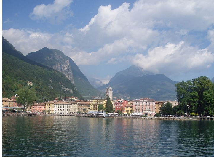
Riva del Garda